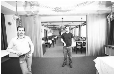
Reflector: „Eine Reise vom Bauch in den Kopf“

An den dichten, komprimierten und straffen Gitarrenwänden auf Reflectors aktuellem Longplayer „Phantoms“ kann man sich den Schädel einrennen. Wände, die sich schwer, behäbig und gewaltig aufürmen, aber auch in punkiger Rohheit – vermittelt durch repetitive Härte – für Druck sorgen können. Dazu ein ungestüm, aber diszipliniert polterndes Schlagzeug. Das Album eint stimmig alle Seiten, die man vom Grazer Zweimannunternehmen bisher gewohnt war: das düster-schaurige Antlitz von Metal, die Kraft des Punk und die zornige Erdung im Noise-Rock.